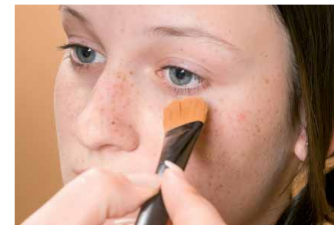
Důsledkem nadměrného slunění často bývá nepravidelná pigmentace pokožky

Současným celosvětovým trendem je učít děti od nejútlejšího věku, jak se chránit před sluncem. Také kosmetička by měla klientele ještě před začátkem letní sezony připomenout základní pravidla pro opalování – nevystavovat se slunci mezi 11. a 15. hodinou, často vyhledávat stín a pravidelně aplikovat krémy s UVA a UVB filtry. Pokud má někdo větší počet pigmentových znamének, měla by mu doporučit, aby je pravidelně 2x ročně nechal prohlédnout dermatologem a při jakémkoliv náhlé změně, jako je krvácení, svědění, zvětšení či zmenšení znaménka, lékaře vyhledal ihned.